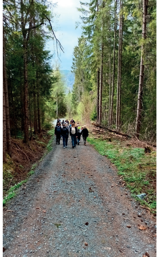
Pilegrimskonfirmantar vandring på sti.

4 laurdagar på våren, samlast konfirmantar frå Øvre Telemark til felleskap og vandring i kyrkjene og ute i naturen rundt og i Brunkeberg, Bø, Kviteseid og Seljord kyrkjer.