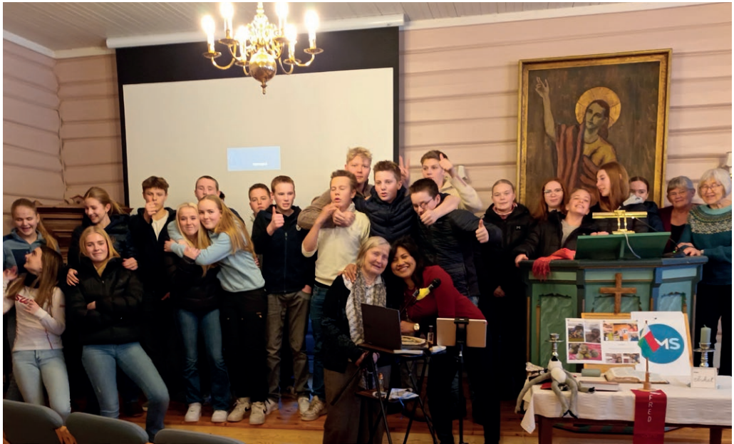
Besøk av Norsk MisjonsSelskap på Misjonshuset.

32 er konfirmantar i Seljord fordelt slik: 2 i Åmotsdal, 7 i Flatdal og 23 i Seljord. (navna tid for konfirmasjon finn du i bladet). I Flatdal kyrkje i november blei presentert på gudstenesta fekk Bibelen. Dei har vore ministrantar på gudtenester i og har deltatt på ljossmessene si lokale kyrkje.